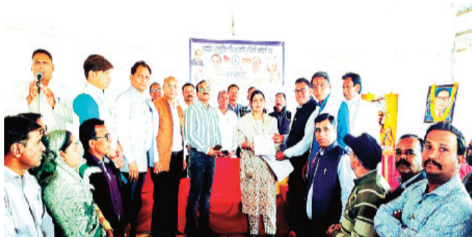
हरिभूमि न्यूज ▶▶ राजगढ़

अनुसूचित जाति, जनजाति अधिकारी, कर्मचारी संघ (अजाक्स) के तत्वावधान में रविवार को स्थानीय मंगल भवन में जिला स्तरीय कार्यक्रम आयोजित किया गया। कार्यक्रम के मुख्य अतिथि