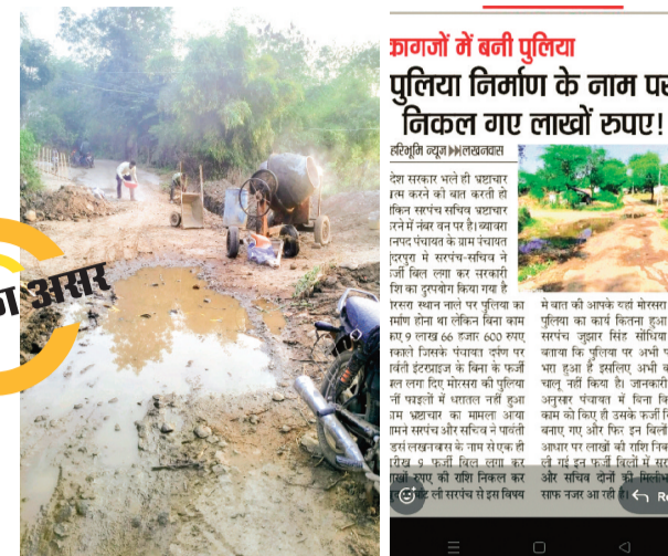
क्रांतियों ने बनी पुलिया पुलिया निर्माण के नाम पर निकल गए लाखों रुपए!

जनपद की ग्राम पंचायत सुंदरपुरा में पहले राशि निकाल ली गई और कई महिनों तक निर्माण कार्य नहीं किया गया। इस पर जब हरिभूमि लखनवास प्रतिनिधि ने मामले को 8 नवंबर के सामचार पत्र में प्राथमिकता से उठाया तब कहीं जाकर प्रशासन के दबाव में ग्राम पंचायत सुंदरपुरा के सरपंच व सचिव ने पुलिया का निर्माण कार्य शुरू करवाया। उल्लेखनीय है कि ग्रामपंचायत सुंदरपुरा की मोरसरा पुलिया निर्माण के नाम से बिना काम किए 9 लाख 66 हजार रुपए सरपंच व सचिव की सांठगांठ से निकाल लिए गए थे जिनका महीनों बाद अब