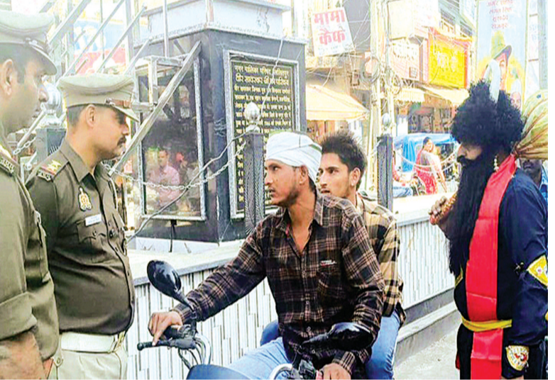
विभिन्न चौराहों पर चलाये गये सड़क चैकिंग कार्यक्रमों के अंतर्गत 207 वाहनों का चालान अभियान के दौरान यातायात पुलिस द्वारा प्रवर्तन किया गया।

अभियान के दौरान सड़क दुर्घटनाओं में कमी लाने के उद्देश्य से और आम जन मानस में हेल्मेट, सीट बेल्ट के प्रति जागरूकता बढ़ने के लिए रचनात्मक यातायात जागरूकता अभियान आयोजित किया। इस कार्यक्रम में जनपद की नाटक मंडली के एक कलाकार को यमराज का रूप धारण कर राहगीरों और वाहन चालकों को हेल्मेट, सीट बेल्ट का प्रयोग करने के साथ-साथ सड़क सुरक्षा का संदेश दिया गया। इसी क्रम में यातायात पुलिस द्वारा शहर भर में वाहन चालकों को यातायात नियमों के प्रति जागरूक किया गया।