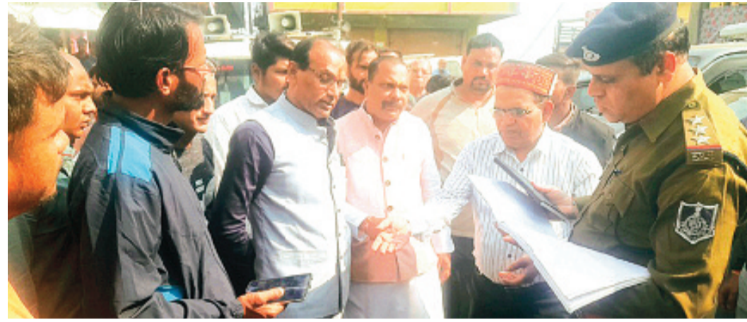
हरिभूमि न्यूज ▶▶ राजगढ़

स्थानीय गणेश चौक वाली गली में मुक्तिधाम मार्ग के समीप शनिवार को नगर के धार्मिकजनों, समाजसेवियों की मौजूदगी में शिव-परिवार मंदिर निर्माण हेतु भूमिपूजन करवाया गया था। उक्त भूमिपूजन होते ही आसपास के कुछ स्थानीय जनों ने इस मंदिर निर्माण पर ही